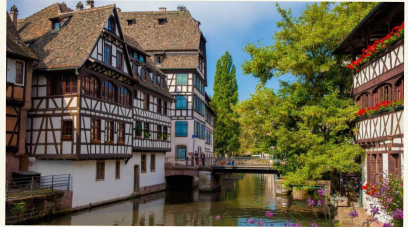
maisons à colombages