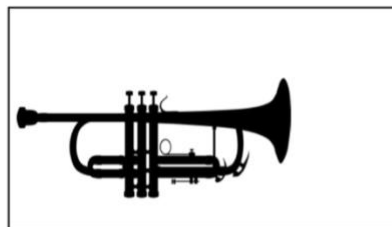
Trompete (ca. 690€)