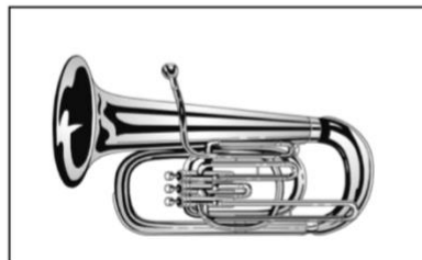
Euphonium (s. Bemerkungen*)