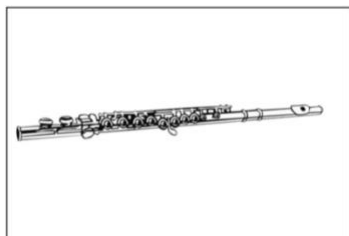
Querflöte (ca. 580€)

Folgende Instrumente sind für die Bläserklasse wählbar: