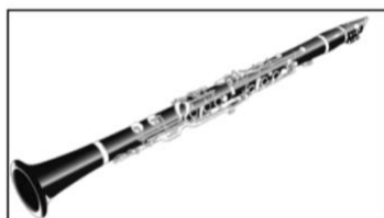
Klarinette (ca. 1150€)