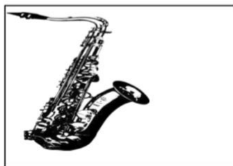
Altsaxophon (ca. 960€)